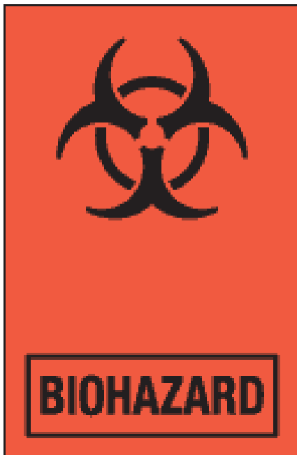
زباله های طبی دارای خطر بیولوژیکی

علامات و سمبول های خطر بیولوژیکی یا خطر سمی